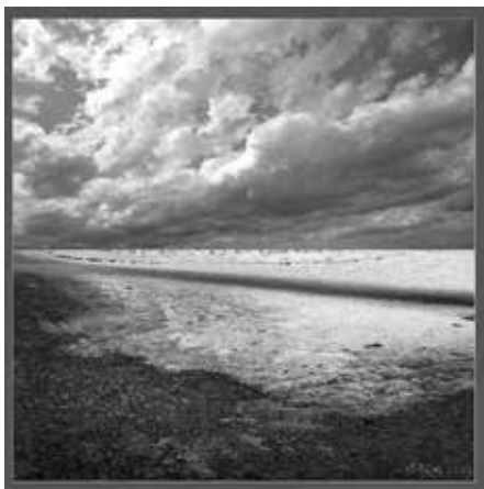
„Eis auf dem Schlossplatz“