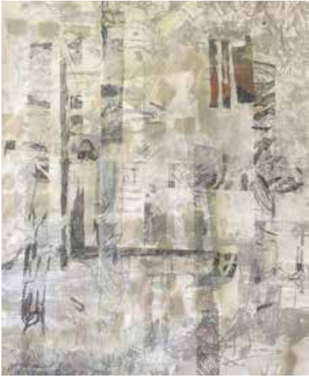
„wieder ordnen und zerfallen“