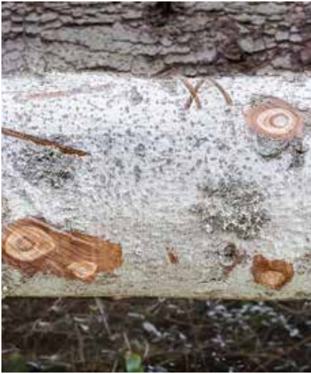
„Gedicht eines Holzfällers“