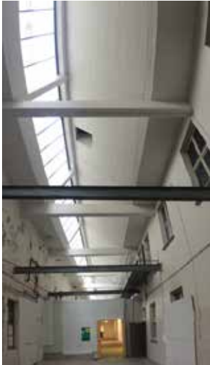
„Panorama II“ (Ausschnitt)