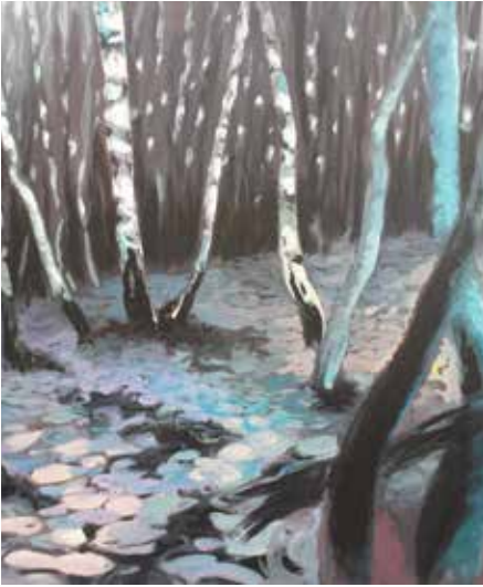
"Schwarzwald, SchwarzWeiß" (Ausschnitt)