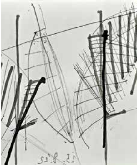
„Ohne Titel“ (Ausschnitt)