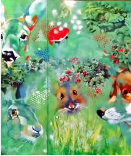
"Everything in the green" (Ausschnitt)