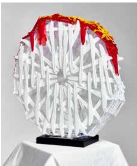
"CuWu1, 1949, Berlin"