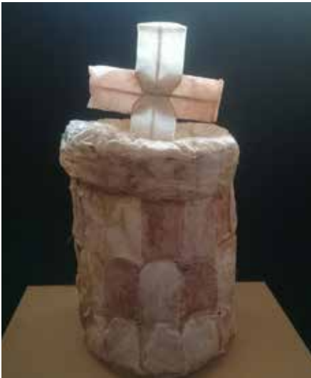
"Meine letzte Behausung"