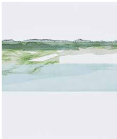
"Gezeiten I" (Ausschnitt)