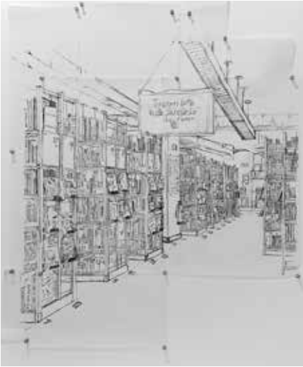
„Blick in die Bib“