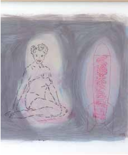
„Liebe und Freundschaft“ (Ausschnitt)