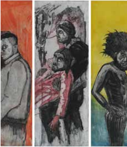
"Die Ohnmacht der Herrschenden" (Ausschnitt)