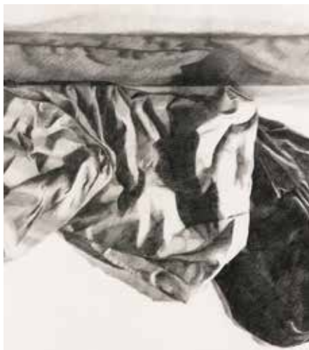
“Sleep Mode I” (Ausschnitt)