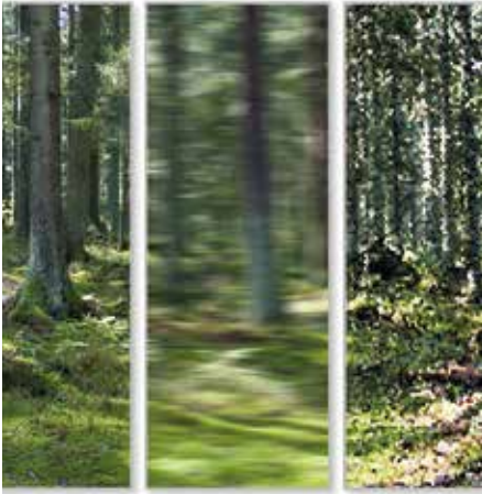
„Lichtung 1“ (Ausschnitt)